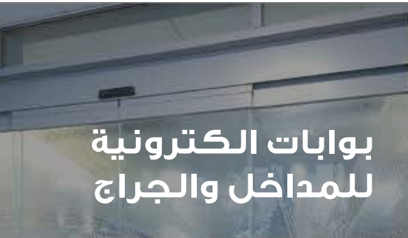
بوابات الكترونية للمداخل والجراج