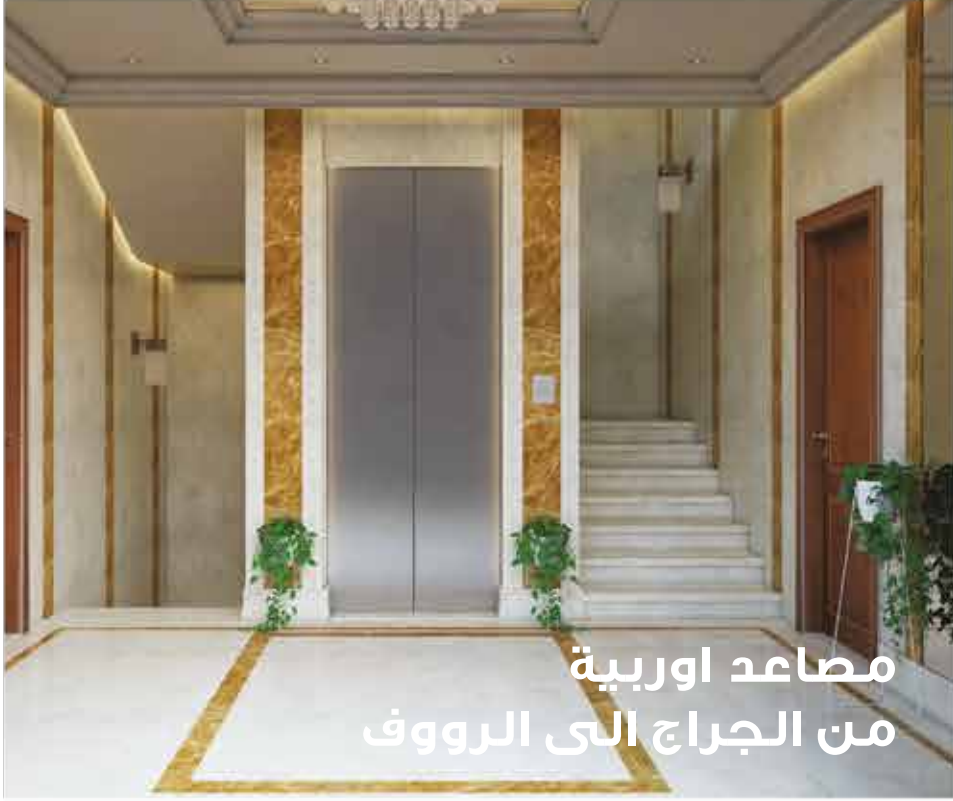
مصاعد اوربية من الجراج الى الرووف